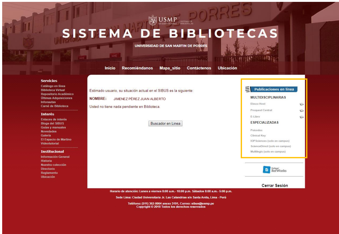
Imagen 3 Sesión iniciada.

Así inicias tu sesión en la página web de la biblioteca central.