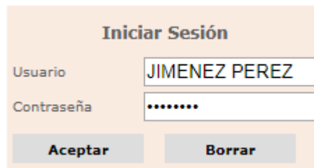
Imagen 2 Inicio de sesión.

CONTRASEÑA : Si eres estudiante usa tu CÓDIGO y si no, usa tu DNI