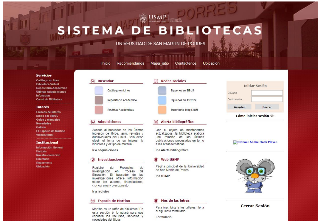
Imagen 1 Página web.

Para acceder a las Bases de datos, ya estando en la página web: http://www.sibus.usmp.edu.pe/ :